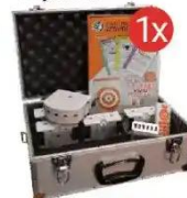
Zestaw szkolny Thymio RF