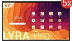
Monitor interaktywny LYRA Pro

Wniosek C - Szkoła Podstawowa (powyżej 1000 uczniów)