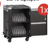
Mobilna stacja ładująca EWENT dla 16 laptopów