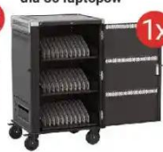
Mobilna stacja ładująca EWENT dla 30 laptopów