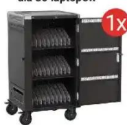
Mobilna stacja ładująca EWENT dla 36 laptopów