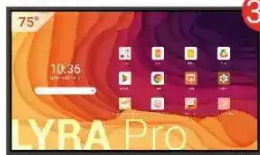
Monitor interaktywny LYRA Pro