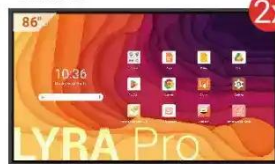
Monitor interaktywny LYRA Pro