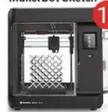
Drukarka 3D MakerBot Sketch