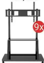
Podstawa do monitora TECHly TR30