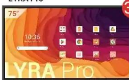
Monitor interaktywny LYRA Pro