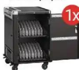
Mobilna stacja ładująca EWENT dla 16 laptopów