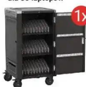
Mobilna stacja ładująca EWENT dla 36 laptopów