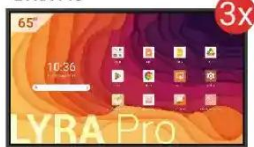
Monitor interaktywny LYRA Pro

Wniosek C - Szkoła Podstawowa (powyżej 1000 uczniów)