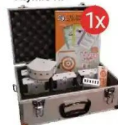
Zestaw szkolny Thymio RF