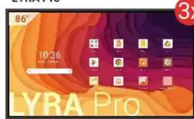
Monitor interaktywny LYRA Pro