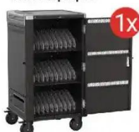
Mobilna stacja ładująca EWENT dla 30 laptopów