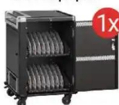
Mobilna stacja ładująca EWENT dla 16 laptopów