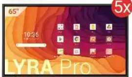
Monitor interaktywny LYRA Pro

Wniosek C - Szkoła Podstawowa (powyżej 1000 uczniów)