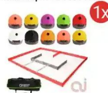
Zestaw AlphaAI Class Pack