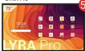
Monitor interaktywny LYRA Pro