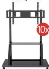
Podstawa do monitora TECHly TR30