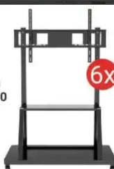
Podstawa do monitora TECHly TR30