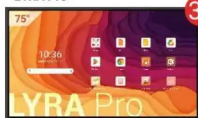
Monitor interaktywny LYRA Pro