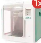
Drukarka 3D robo E3