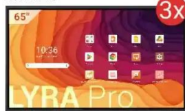
Monitor interaktywny LYRA Pro

Wniosek C - Szkoła Podstawowa (od 301 do 600 uczniów)