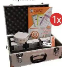
Zestaw szkolny Thymio RF